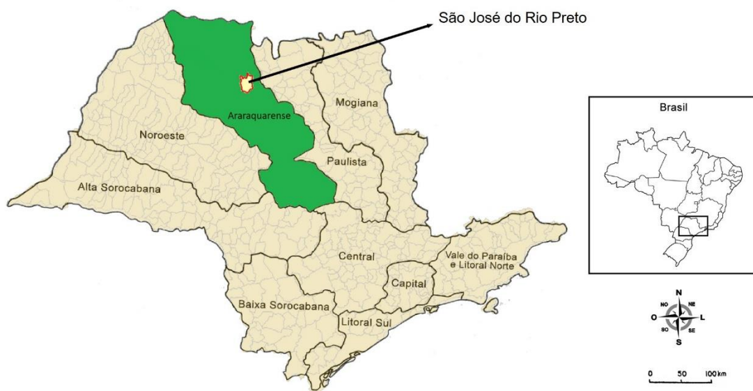
Mapa 1 – Divisão regional do estado de São Paulo, com destaque para a Araraquarense, 1920

A Araraquarense se constituiu como uma zona intermediária entre as áreas mais antigas do Oeste Paulista, cobertas pelas ferrovias Mogiana e Paulista, e as mais novas a oeste, como a Alta Sorocabana e a Noroeste (Holloway, 1984, p. 41). Luna e Klein apontam que na safra de 1905-06 a Mogiana era a principal produtora, seguida pela Baixa Paulista. Entretanto, a partir dos anos 20, a produção cafeeira da Araraquarense já superava a da Baixa Paulista e a partir da safra de 1926-27 também passou a superar a da Mogiana. O primado da Araraquarense como região cafeeira mais produtiva do estado se estendeu por cerca de uma década, até a safra de 1935-36, quando a região Noroeste a sobrepujou (Luna e Klein, 2019, p. 182).