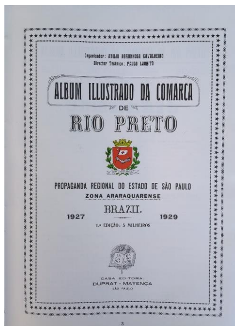
Figura 2 - Página de rosto do Album Ilustrado da Comarca de Rio Preto .

vista econômico, o projeto foi à época um fracasso, devido ao alto custo da impressão, finalizada em papel glacé e que incluiu mais de 2 mil fotos, algumas delas coloridas. Na página de rosto da obra consta o escudo do estado paulista e, abaixo dele, a menção “Propaganda regional do estado de São Paulo – Zona Araraquarense”, indicando que haveria apoio financeiro do estado. De fato, mais de trinta páginas iniciais, com fotos, foram dedicadas a diversas autoridades: presidente Washington Luís, governador e candidato à presidência Julio Prestes, vice-presidente Heitor Penteado, o candidato ao governo do estado Ataliba Leonel, vários secretários, chefe de polícia, presidente dos legislativos paulista e paulistano e prefeito da capital. Ocorre, porém, que o crash da bolsa americana ocorreu menos de um mês após a impressão da obra pela Casa Editora Duprat – Mayença em São Paulo. Tudo indica que o apoio oficial não saiu, ou saiu muito aquém do esperado, o que frustrou os envolvidos na empresa. Silva e Campos (2021) apuraram, por exemplo, que após a publicação do Album , toda a família de Paulo Laurito foi levada à falência.