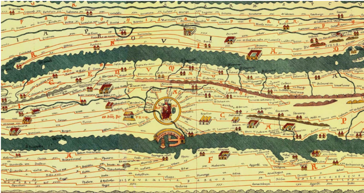
Figura 1: Fragmento do mapa de Peutinger realizado no século xv, como cópia de um mapa romano. O mapa apresenta os caminhos entre cidades romanas e a capital do império romano. Disponível em: bit.ly/2wwk2je . Acesso em: 26 mai. 2019.

marítimas e das distâncias percorridas a pé entre as localidades conquistadas (DILKE, 1987, p. 235). A técnica cartográfica romana, consolidada por Ptolomeu, residia na união dos saberes astronômicos, matemáticos e empíricos de seus viajantes. Assim, a prática do deslocamento humano mostrava-se como fundamental para o desenho dos mapas na Roma Antiga.