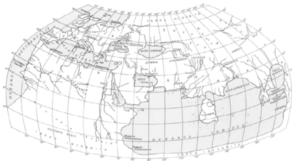
Figura 2: Uma reconstrução do mundo de Claudius Ptolomeu por Edward Herbert Bunbury em 1883.

nhados de maneira a convergir para a cidade de Roma, e o mapeamento pautava-se na intenção de controle territorial. Para controlar as terras era preciso conhecê-las, portanto, os esforços de Ptolomeu buscavam a precisão no representar geográfico, promovendo a adequação do mundo à uma grade ortogonal. A adequação sistemática dos lugares e seus caminhos, visava instaurar um conjunto de regras na busca por um mapa do mundo, habitado e inabitado, que permitisse a previsibilidade e, por consequência, a exatidão.