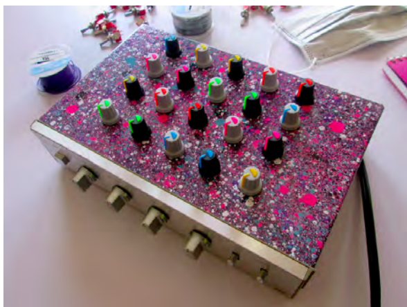
Figura 1. Sintetizador analógico criado no laboratório Tachyons+.

Mesmo quando as pessoas clonam, copiam ou usam a cultura de base como o único caminho, ainda soa como uma autenticidade criativa devida a natureza baseada na antimatéria de tudo isso. Corrompendo, interrompendo, desestabilizando. Talvez seja uma resposta unissonante ao artificial e moderno mundo de plástico da cultura dos smartphones.