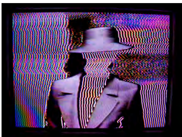
Figura 2. Efeitos de "fantasma na televisão" possíveis de serem feitos com os sintetizadores.