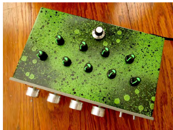
Figura 3. Sintetizador analógico criado no laboratório Tachyons+.