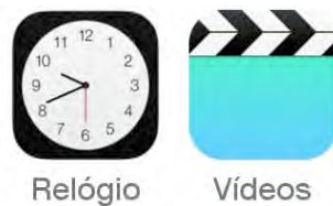
Figura 1. Os ais Relógio (1) e Vídeos (2).

O estudo apresentado aqui propõe uma análise semiótica dos signos dos aplicativos do sistema operacional iOS 8 da Apple, chamados comumente de ícones de aplicativo, ou app ícones (“ais”, abreviatura de app ícones, adotada no artigo para referenciar ícones de aplicativos). Na ocasião do lançamento do iOS 7 em 2013, os designers da Apple introduziram o conceito de “design esqueumórfico” para descrever um tipo de design que eles já declaravam ultrapassado. Como explica o jornalista G. F. Seattle, num artigo do Economist de 25 de junho de 2013, esqueumorfismo é um princípio imitativo do design, no qual se emprestam elementos do design de objetos já consolidados e históricos para representar novos objetos que possuem uma realidade material diferente do seu design (cf. http://goo.gl/3b9AU6 ). O jornalista cita alguns exemplos, como o design de uma colher de plástico (o esqueumorfo) que imita o brilho da prata de uma colher de prata genuína, ou como o design da textura dos assentos de um carro que imita a textura do couro de um modelo luxuoso. Um exemplo de design esqueumórfico na interface dos usuários de um smartphone seria o design de uma agenda que imita a aparência de uma agenda tradicional feita de papel encadernado. É este tipo de design que os projetistas do iPhone consideram obsoleto.