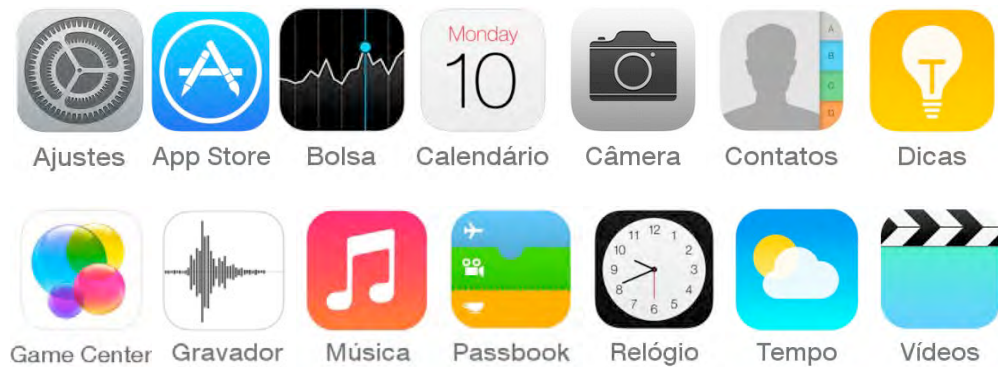
Figura 2. Seleção de ais nativos: Ajustes (3), App Store (4), Bolsa (5), Calendário (6), Câmera (7), Contatos (8), Dicas (9), Game Center (10), Gravador (11), Música (12), Passbook (13), Relógio (14), Vídeos (15), Tempo (16).

Uma característica dos ais é que o signo consiste sempre de uma imagem e uma legenda verbal resumindo a função do “botão”. No guia inglês iPod-iPhone-iPad-Icons-Guidelines.pdf da empresa, a imagem dos ais é chamada de “ícone” e a parte verbal, de “texto”. O guia enfatiza: “Nunca separe o ícone do texto.” Cada ai é, portanto, um signo duplo, com uma parte icônica e uma parte verbal. O texto identifica o ícone e dá um resumo da função do aplicativo. O resultado desta duplicidade pode ser informativo, como no caso dos ais Game Center (10) ou Passbook (13), onde o design do ícone não permite adivinhar a sua função. Em outros casos, o resultado da duplicidade do signo é mera redundância, como no caso dos ais Relógio (14) ou Câmera (7), onde a imagem já traduz a função do botão.