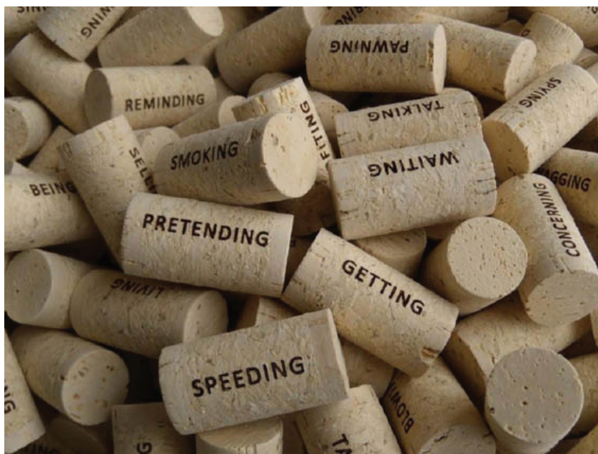
Imagem 5: Detalhe da impressão dos verbos em rolhas de cortiça