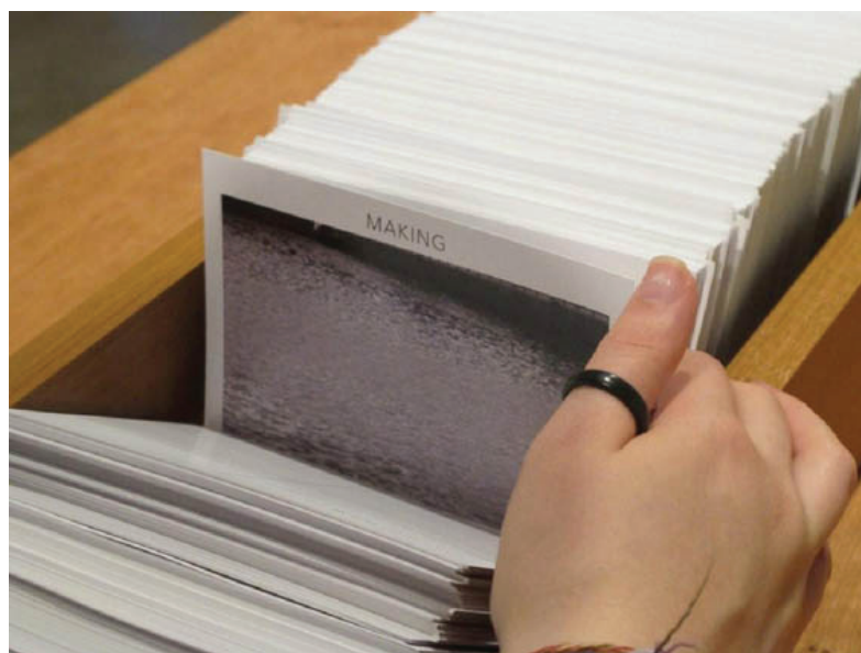
Imagem 8: Detalhe da caixa de madeira com cartões-postais na instalação DUBLING

Fui seguindo a dinâmica da concepção de cada elemento, dedicando-me a providenciar a compra das rolhas e a respectiva impressão a laser das palavras em cada uma delas, bem como a criação dos cartões postais. Sem dúvida, a formatação das palavras para impressão seguiu à risca a nossa primeira rolha: A fonte e o tamanho da letra foram sugeridas pela esperança. O fato de morar no Rio grande do Sul favoreceu o encontro com a matéria prima. Uma vinícola da cidade de Bento Gonçalves foi o meu primeiro fornecedor. Para a impressão, é claro, fui buscar