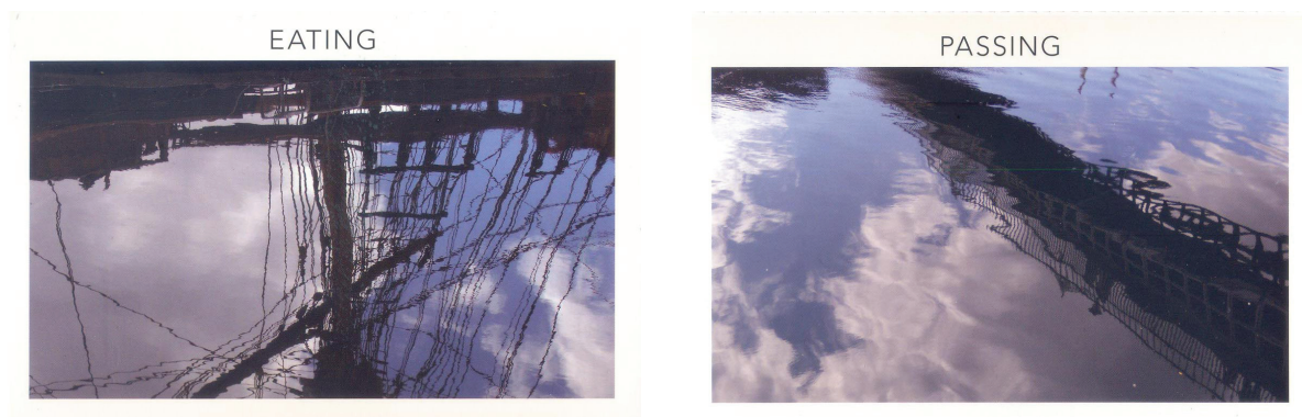
Imagem 9: Cartões postais com imagens do rio Liffey (Dublin)

colocando os verbos sem sua intervenção. Eu não gostaria que o gerúndio viesse a cumprir a função de legenda nem que a imagem se tornasse ilustração do verbo. Mesmo que em algumas vezes possa parecer que houve indução, é preciso confiar em minha aposta no acaso.