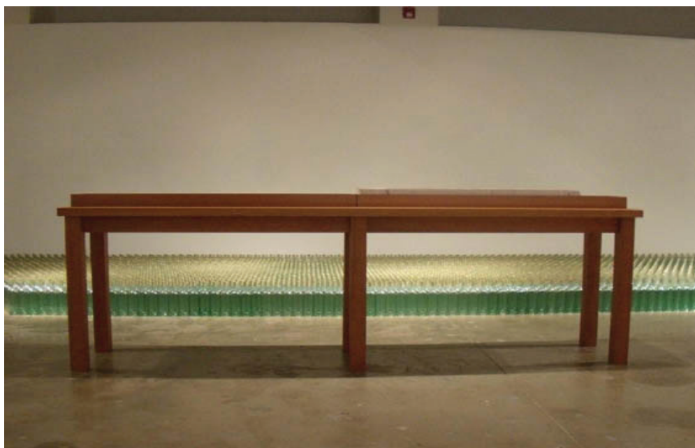
Imagem 1: Vista parcial da instalação DUBLING

DUBLING é um trabalho que nasce assumindo a potência de um verbo no gerúndio 1 . A ação de caminhar pelas vias de uma cidade lendo em voz alta, quando as ruas por onde se passa são o próprio cenário das páginas do livro, eis a vertigem propulsora de um processo de criação. Neste relato, informações vazam como transbordamento da experiência, naquilo que ela tem de fluido e vaporoso. O caráter confidente do texto aposta no valor do testemunho e no diálogo com o leitor, tecendo conversas que incluem elementos da arte e da literatura. (imagem 1)