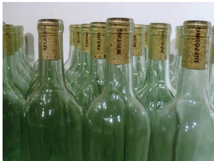
Imagem 7: Detalhe das garrafas arrolhadas na instalação DUBLING

Um gerúndio escapa da lista e instala-se em um gesto quando, em uma das noites em que eu estava retornando para casa, escolho um vinho para acompanhar o jantar. Foi o rótulo da garrafa o que primeiro chamou minha atenção: um desenho em aquarela sobre fundo branco, algo que identifiquei como um pássaro em exercício de vôo. Um rastro. A vinícula não era conhecida, mas o texto descritivo do conteúdo da garrafa convenceu-me a comprar a bebida. Qual não foi a minha surpresa quando da retirada da rolha, onde aos poucos letra a letra, pude ler a palavra E S P E R A N C E . Grafada em tom marrom sobre a cortiça, ali estava a solução para o problema que geralmente tem motivado meus últimos trabalhos: onde colocar a palavra? Naquela noite, o brinde foi feito não somente à esperança propriamente dita, mas à dimensão histórica e afetiva de um readymade. Já não se trata somente do gesto inaugural de Marcel Duchamp, de deslocar um objeto do contexto cotidiano ao espaço do museu de arte, mas estender este vôo, este traço fluido que faz a passagem do conteúdo do livro para o processo de uma criação artística. Brindamos o princípio esperança neste lance do acaso.