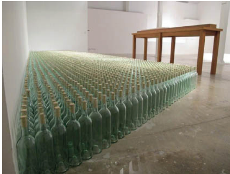
Imagem 4: Vista parcial da instalação DUBLING