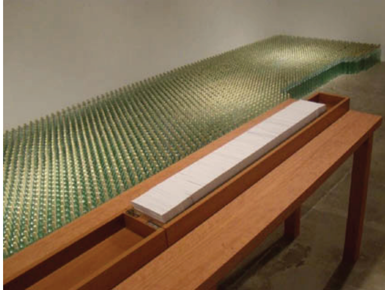
Imagem 3: Vista parcial da instalação DUBLING

Dubling assume o presente acontecendo, tão bem evocado por Donaldo Schüler: O sonho anula distâncias. Há um presente absoluto, o presente acontecendo, conjugação do passado e do futuro [...] A cidade mágica e estranha, passou pela transformação da arte. A cidade é monumento, quadro. [...] A arte costuma tornar estranho o familiar jogo de simulacros. (SCHÜLER, 1999) 2 : (imagem 3) (imagem 4)