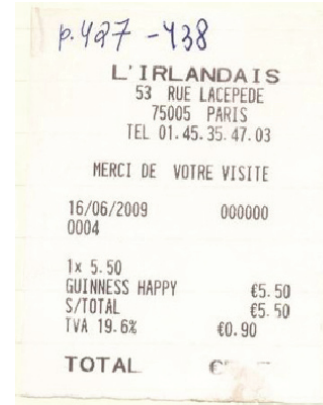
Imagem 6: Documentos de processo: Notas de consumo em um café parisiense