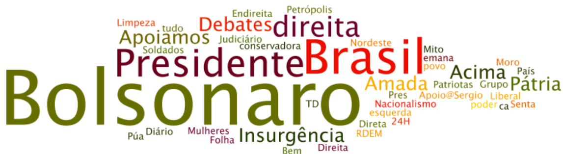
Gráfico 1 – Nuvem de palavras com os nomes dos grupos

A rede aqui apresentada foi desenhada durante 10 dias, entre 1º de junho e 10 de junho de 2019. Durante esse período, o pesquisador aceitou convites dos grupos em que estava inserido para integrar grupos que, por seu nome, indicassem discussão política à direita. Uma análise da nuvem de palavras dos nomes dos grupos evidencia a concentração de apoio ao presidente Bolsonaro, representado por seu próprio nome e pelo termo “presidente” e “mito”. Num segundo nível, temos “direita” e os vocábulos “apoiamos” (com a variação “apoio”), “debates”, “pátria” e “amada”. Também aparecem referências a conceitos como nacionalismo e liberalismo e, em menor grau, elementos regionais (nordeste, norte etc).