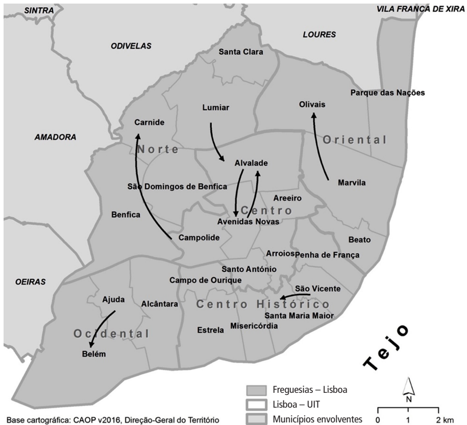
Figura 2 – Principais fluxos de mudança de residência entre freguesias

A análise do peso dos movimentos residenciais oriundos de fora da cidade (Figura 3) permite destacar que a maior parte dos novos