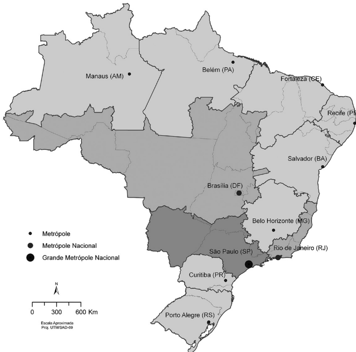
Figura 1 – Regiões de Influência direta das principais metrópoles brasileiras (REGIC 1997)

Fonte: Extraído e adaptado de IBGE 2007.